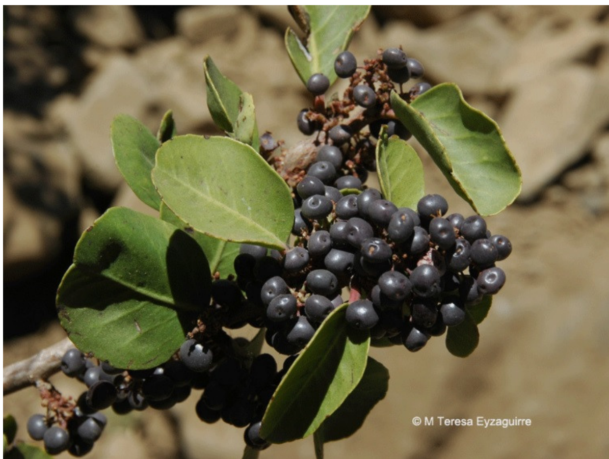
Figura 7.- Schinus montana, litrecillo, arbusto endémico que se distribuye desde la Región de Valparaíso hasta la Región de O'Higgins.