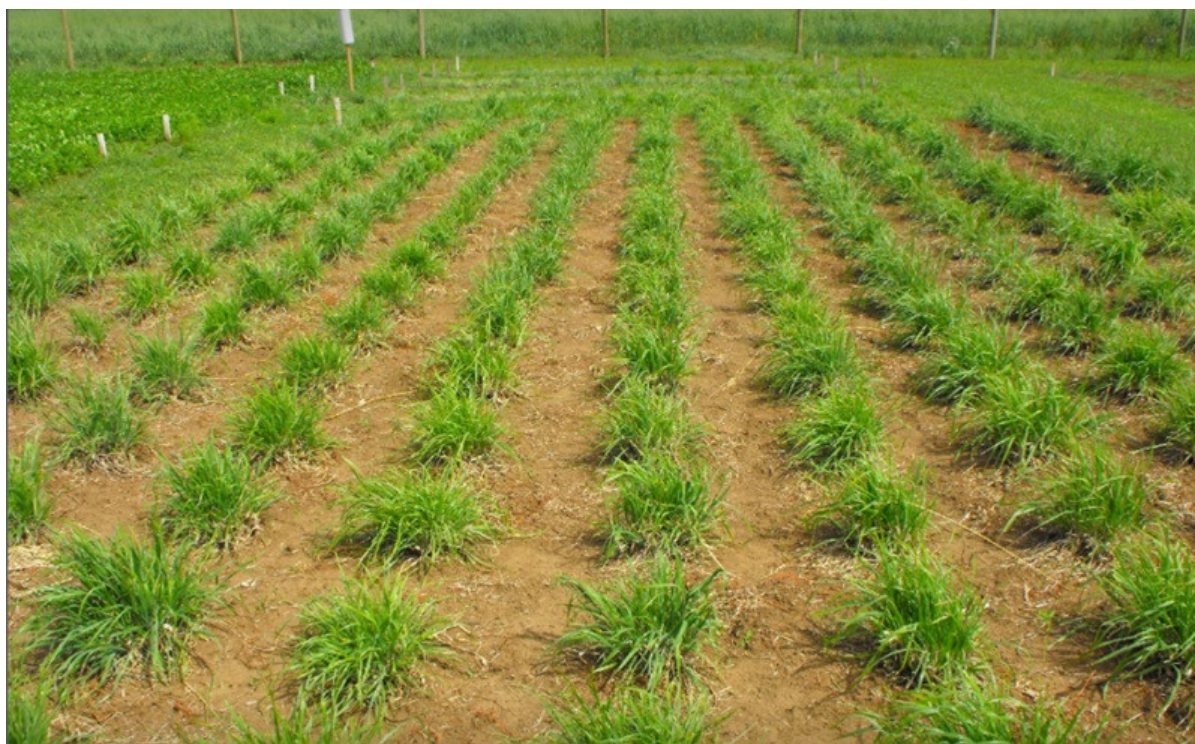
Figura 6.- Poker INIA, una mezcla forrajera de Bromo con gran persistencia y rusticidad.