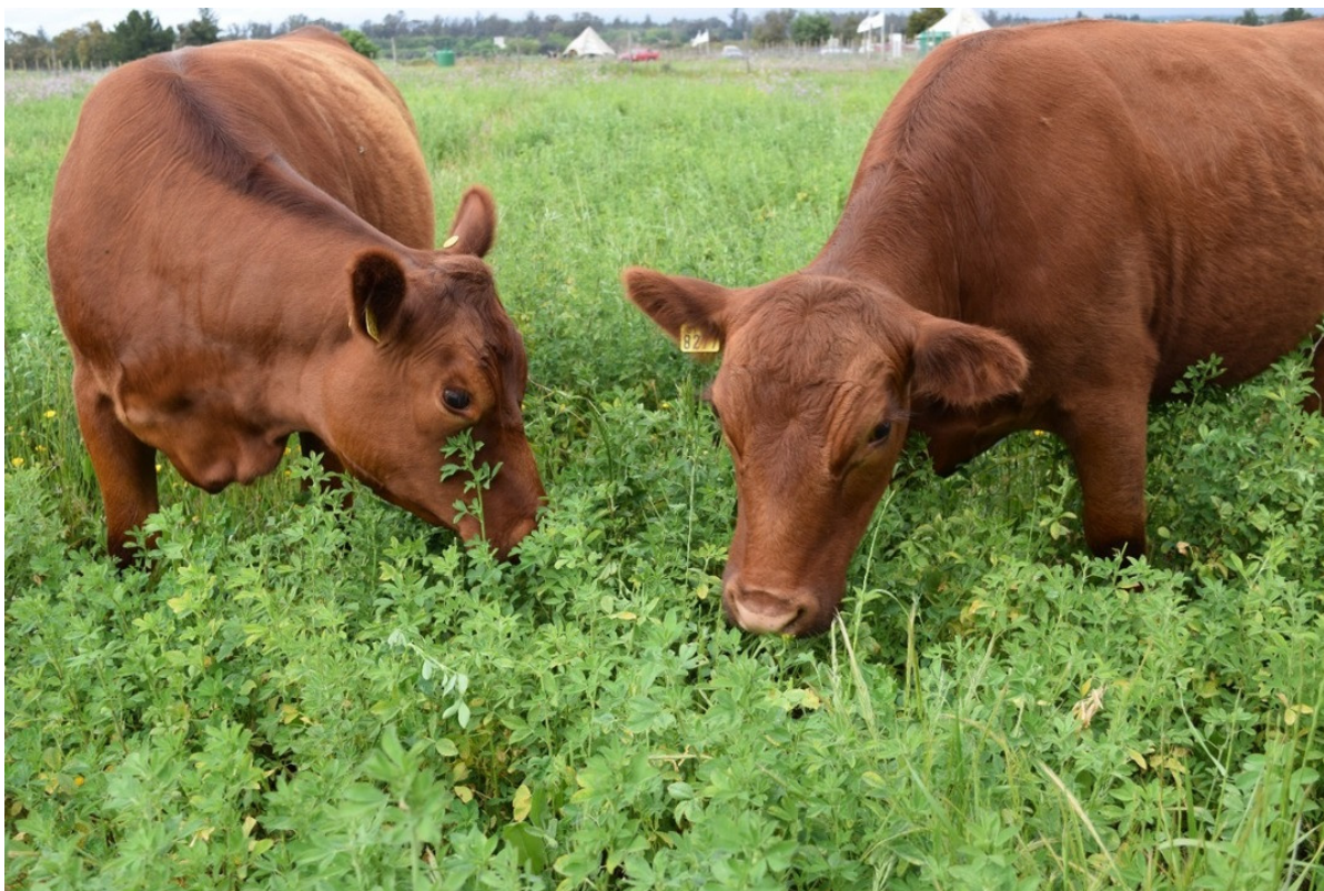
Figura 6.- INIA realiza estudios de la genética del cultivo de alfalfa.