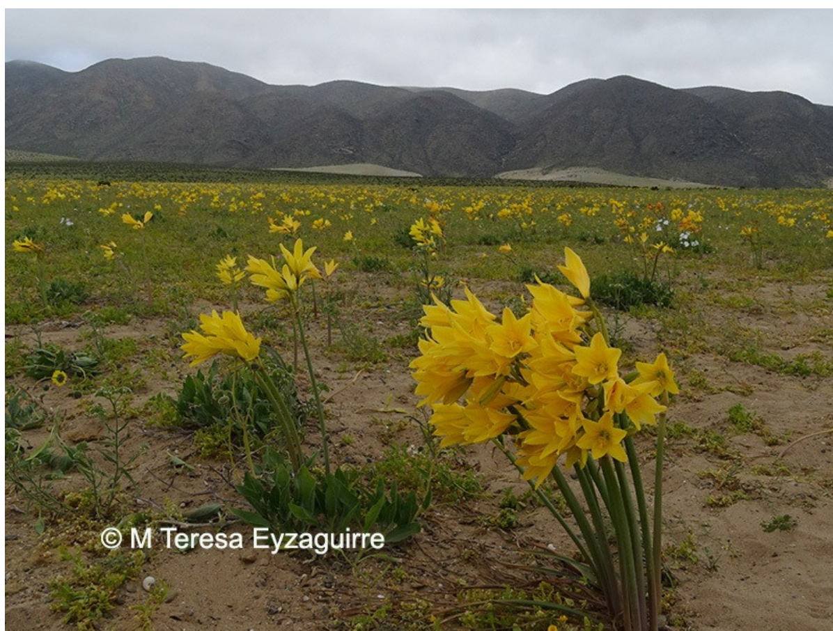
Figura 7.- Añañuca, Zephyranthes bagnoldii . Hierba endémica distribuida entre las regiones de Antofagasta a la de Coquimbo.