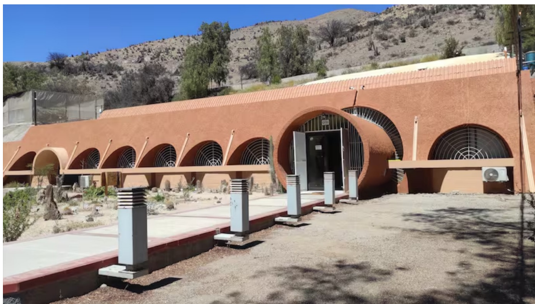
Figura 6.- Banco base de germoplasma en INIA Intihuasi, camuflado entre cerros de Vicuña