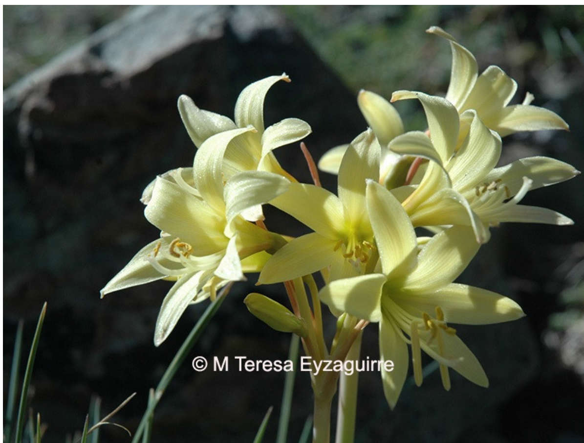
Figura 7.- Zephyranthes montana , Añañuca. Hierba endémica distribuida entre la región del Maule y la de La Araucanía.